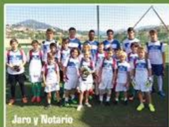
Jaro y Notario

INSTALACIONES PROFESIONALES 8 CAMPOS DE CÉSPED NATURAL