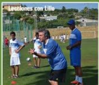
Lecciones con Lillo

PRECIOS ESPECIALES (CURSO COMPLETO) PARA GRUPOS, ASOCIACIONES O CLUBES DE FÚTBOL A PARTIR DE 5 INSCRITOS.