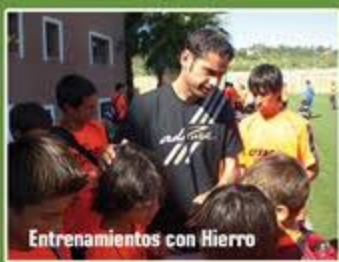
Entrenamientos con Hierro